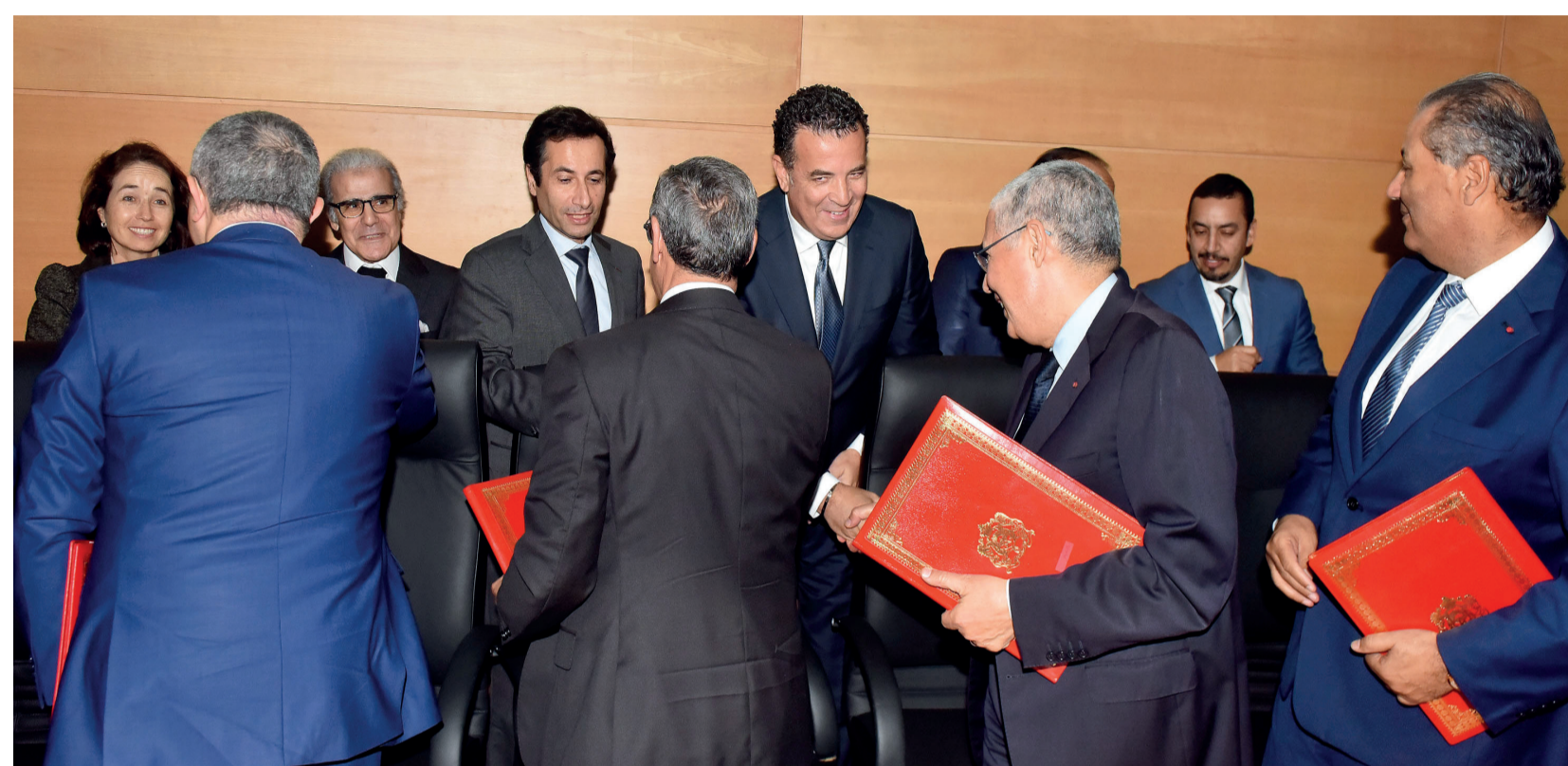
Les mesures annoncées par le GPBM étaient dans le pipe depuis plusieurs jours.

Quelques jours après cette déclaration, des échos circulant dans le monde des affaires, laissent entendre que les décisions actées ne sont pas appliquées. De nombreuses entreprises peinent à financer leur besoin en fonds de roulement, et les pro-