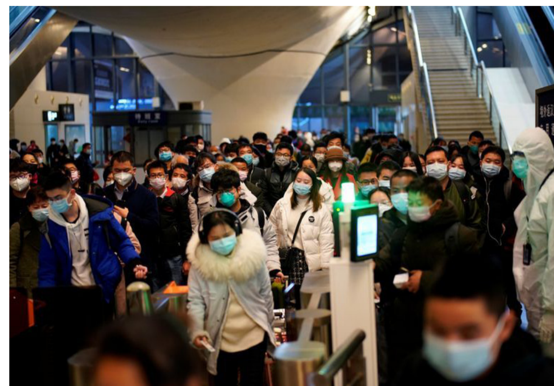
Signe d'espoir, Wuhan la chinoise émerge de sa quarantaine

Plus de 10.000 morts en Italie, Trump pense isoler New York