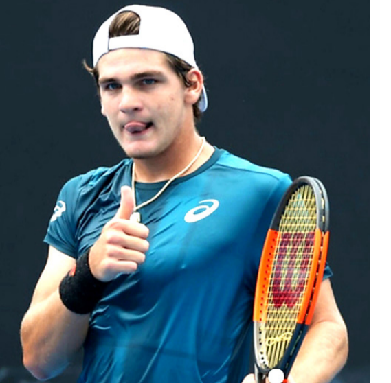
Le Brésilien Thiago, le premier testé positif.

«Je voulais vous dire que j'avais contracté le Covid-19, il y a dix jours. J'ai eu des symptômes, fièvre et état grippal. Mais d'ici peu, la période d'incubation de la maladie va se terminer et je vais guérir. Je récupère, j'ai pris soin de moi en suivant les instructions du médecin. Je voulais, surtout, vous rappeler de rester à la maison, de prendre soin des personnes que vous aimez et de nous aider à ne pas propager cette maladie. C'est une maladie à prendre au sérieux et qui peut être contrôlée avec l'effort de tous. Alors restez chez vous et en bonne santé», devait exprimer cet natif de Rio de Janeiro qui avait dominé, en finale de l'ATP de Santiago, le Norvégien Casper Ruud. Et c'est en 2018 qu'il avait brillé de