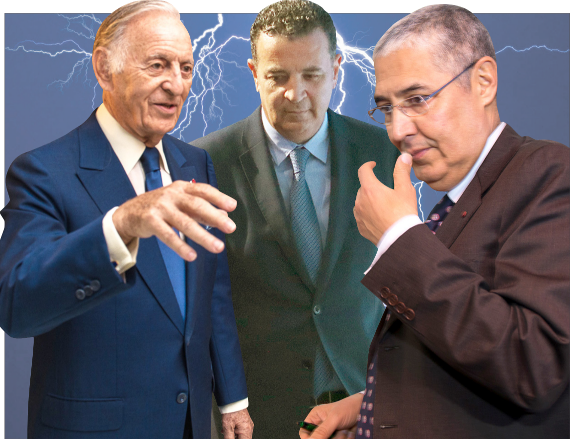
Une confrontation aussi rare que violente.